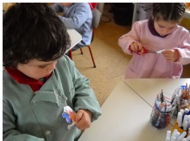
Recortámos os trevos...