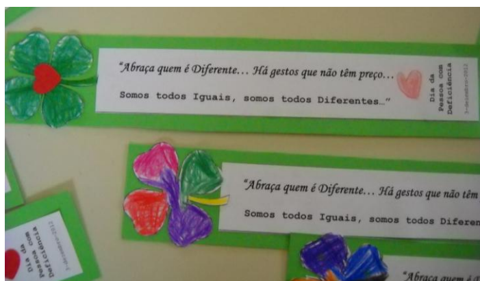
Colámos os trevos e as frases...