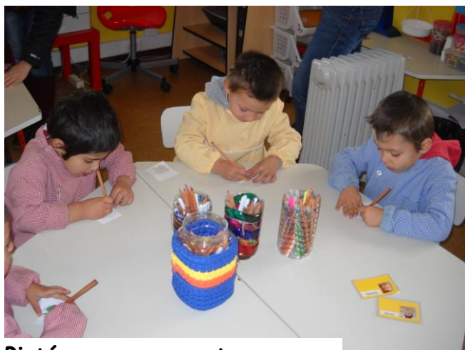
Pintámos pequenos trevos...