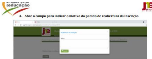
Figura 3 - Indicar o motivo do pedido de reabertura da inscrição