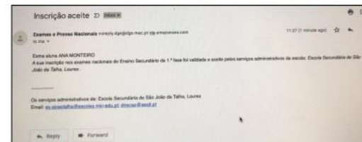
Figura 5 - Exemplo de e-mail enviado pela escola a informar que a inscrição foi validada e ACEITE