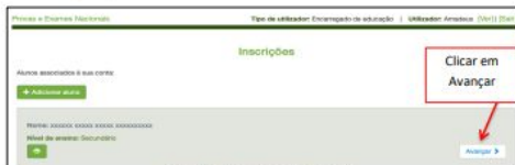
Figura 2 - Avançar para alterar inscrição