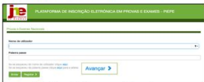
Figura 1 - Acesso à plataforma com o seu utilizador e palavra-passe

Introduzir os seus dados de acesso (o nome de utilizador e a palavra-passe) e clicar em Entrar