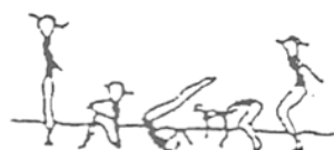
Rolanento à retaguarda (10%)