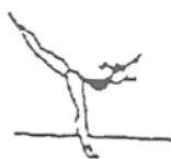
Posição de equilíbrio (5%)