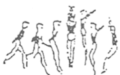
Corrida e salto em extensão com 1/2 volta (5%)