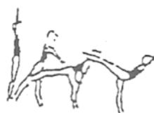
Posição de equilíbrio (avião, bandeira, etc.) (5%)